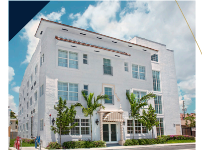
THE JEFFERSON HOTEL Período: 2014 - 2018