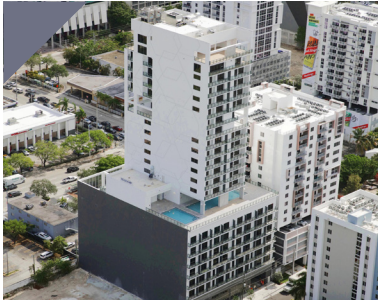
SMART BRICKELL TOWER 1 Período: 2017 - 2023