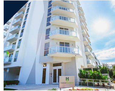
HABITAT RESIDENCE I Período: 2006 - 2010