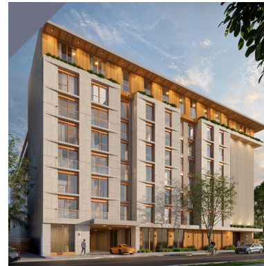
PARKSIDE Uso Mixto 185 Unidades, 2 Espacios Comerciales 2024 - 2027