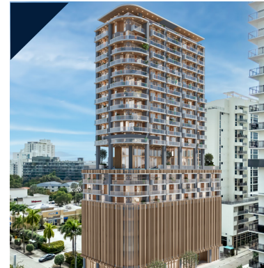
SEASON ONE Uso Mixto 80 Unidades, 2 Espacios Comerciales 2024 - 2027