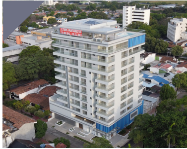
LE PARC - COLOMBIA Período: 2018 - 2021