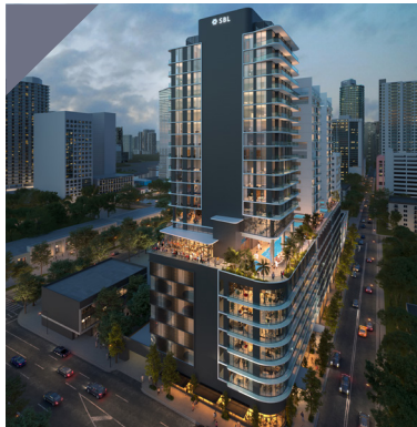
SMART BRICKELL LUXE Uso Mixto 131 Unidades, 4 Espacios Comerciales 2022 - 2026