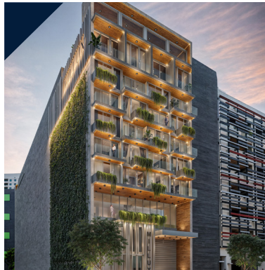
MILLUX PLACE Uso Mixto 99 Unidades, 2 Espacios Comerciales 2023 - 2027