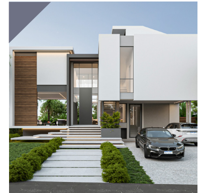
KEY BISCAYNE Portafolio de Casas 3 Casas 2023 - 2026