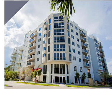
HABITAT RESIDENCE II Período: 2010 - 2014