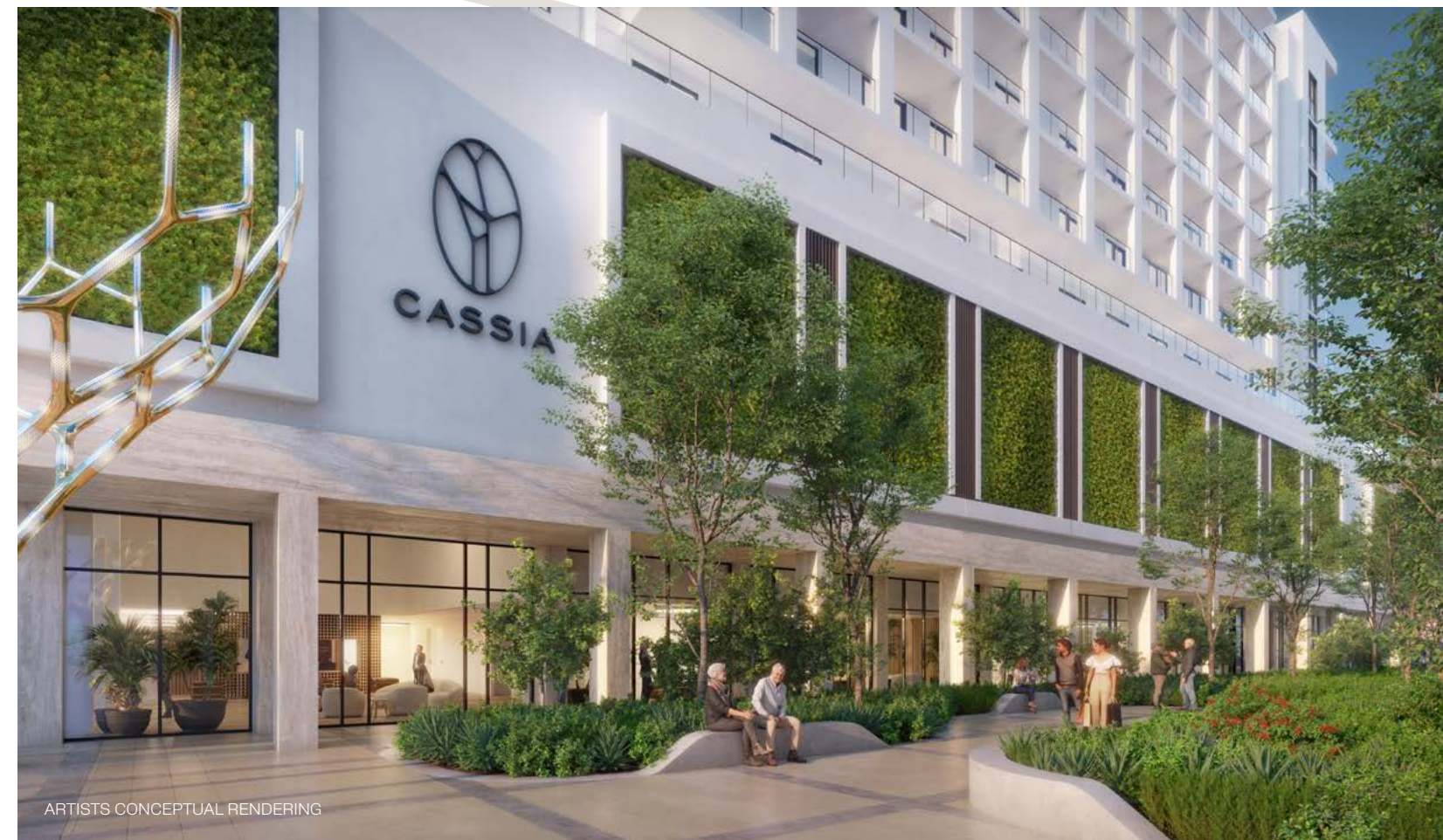
ARTISTS CONCEPTUAL RENDERING